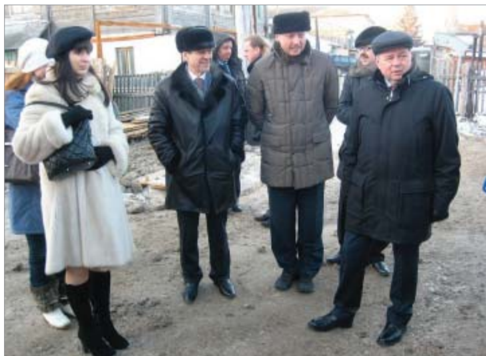
В плотном графике своего визита в Козельский район губернатор А.Д. Артамонов нашел время посетить строящиеся объекты в городе Воинской славы - Дом культуры и баню.

Отвечая на вопрос, когда в районе вновь откроется роддом, министр заметил, что здание, где ранее располагалось родильное отделение, мягко говоря, не соответствовало статусу этого