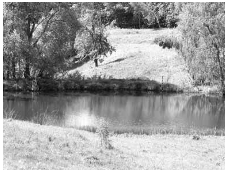
Пруд в деревне Дементеевка.