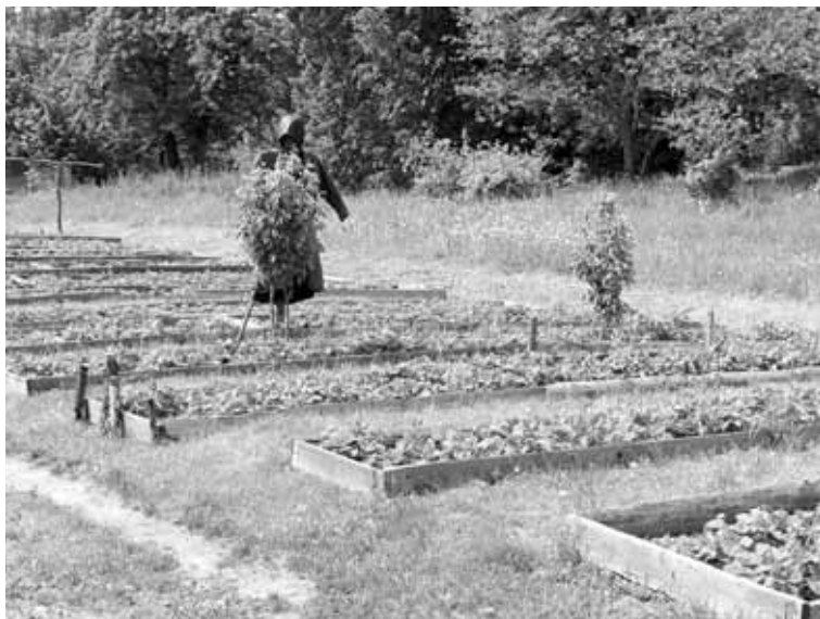
Грядки с клубникой охраняют чучело.