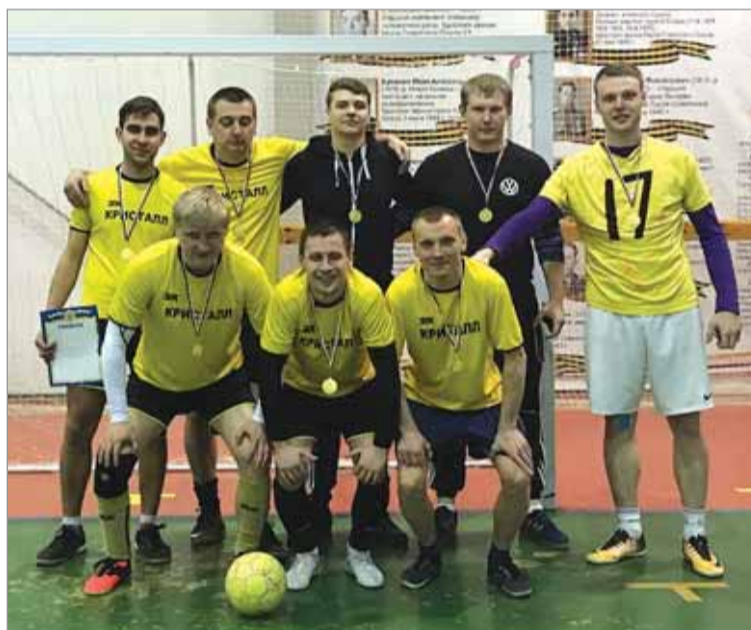
Победитель турнира команда «Кристалл».

На днях прошли две финальные игры чемпионата Козельского района по мини-футболу. Начиная с октября прошлого года в нем приняли участие 12 команд.