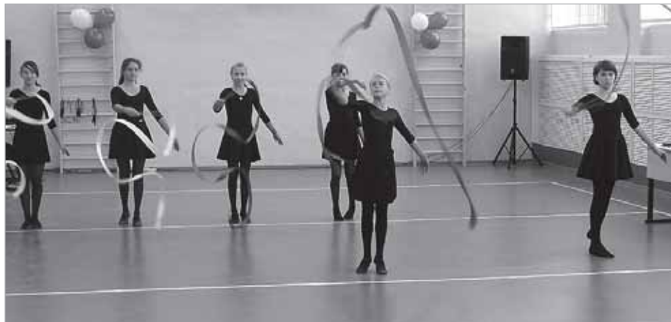
Танец с лентами.