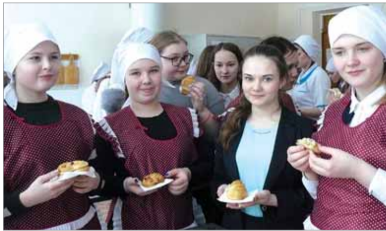
В гостях у студентов учащиеся Козельской СОШ №1.

Тесные связи у студентов третьего курса по специальности «Повар-кондитер» налажены с коллективами школ города Сосенского и Козельской школой №1. На базе техникума для учащихся постоянно проводятся мастер-классы с практическим занятием по приготовлению блюд.