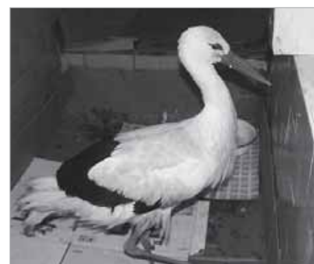
Любимец посетителей - аист Потап.