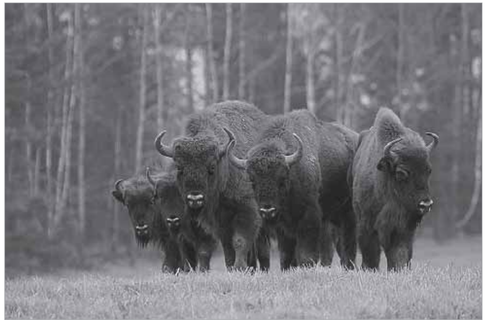
Гордость НП «Угра» краснокнижные зубры.